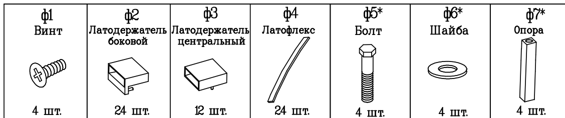
Схема сборки основания кровати